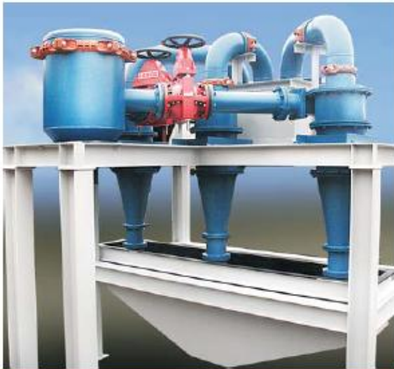
Nido Lineal de 03 Hidrociclones D15B Cía. Minera Milpo