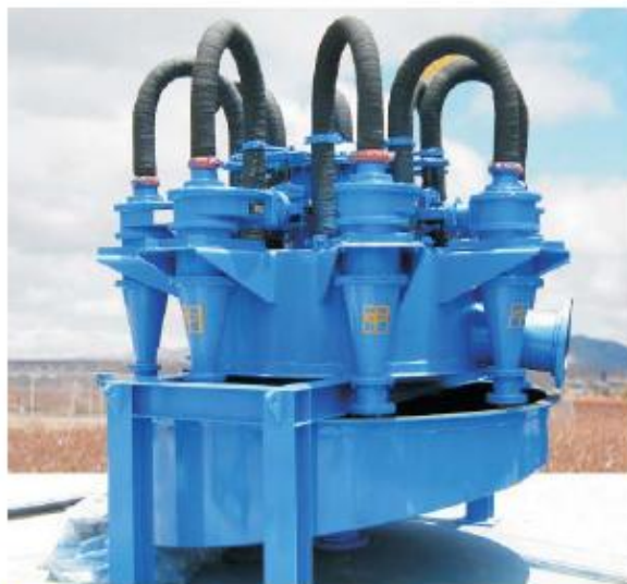
Nido Radial de 8 Hidrociclones D10B Cia. Minera Condestable S.A.

Este tipo de distribuidor es aplicable más eficientemente cuando la concentración de sólidos es