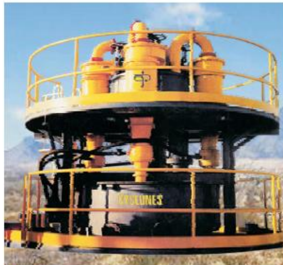
Nido Radial de 4 Hidrociclones DS20B con cyclowash Southern Perú Copper Corporation