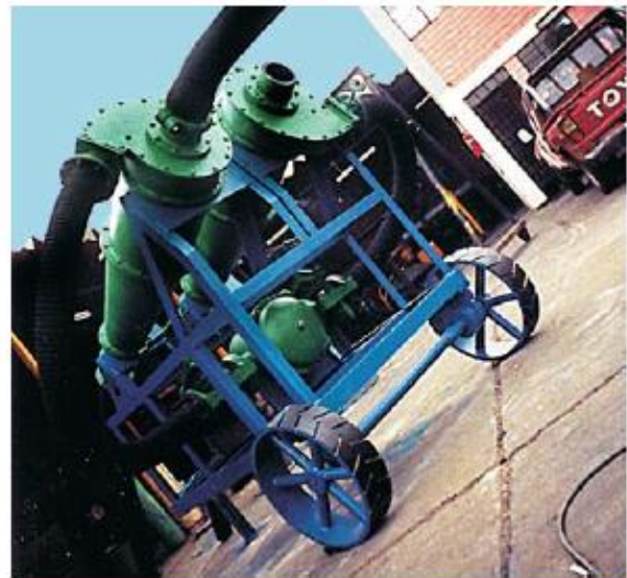
Nido Móvil de 02 Hidrociclones D20B Unidad Rosaura