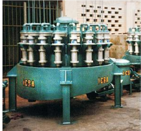
Nido Radial de 18 Hidrociclones D4BB12 MINSUR S.A.