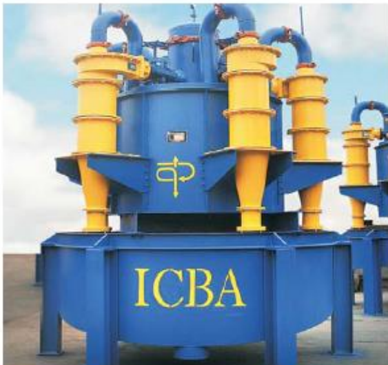
Nido Radial de 5 Hidrociclones D15BB VOLCAN S.A.A.